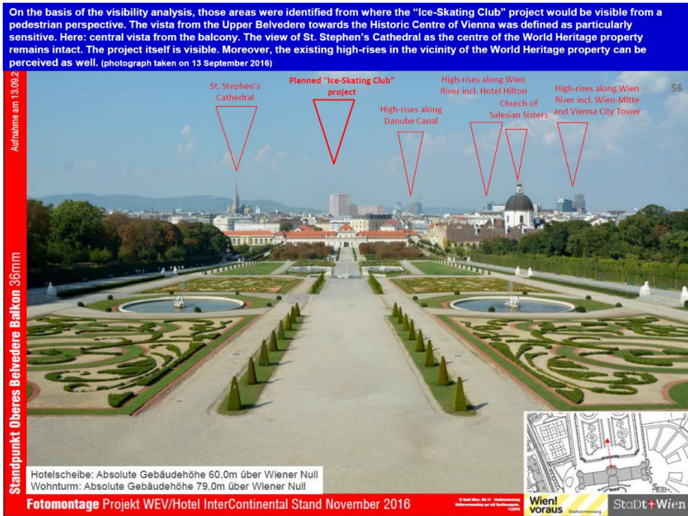
Foto 4: De (toekomstige) zichtas vanaf het Belvédère op de binnenstad van Wenen en op het ingetekende project 'Ice-Skating Club'. Deze zichtas, die nu nog open is en waarbij de St. Stephans kathedraal (links) een belangrijk baken is, is een vastgelegde OUV van het werelderfgoed.