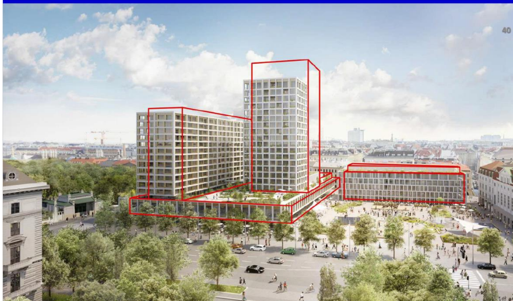
Foto 3: geplande nieuwbouw. In rood de oorspronkelijk bedoelde bouwhoogte/bouwvolume. De bouwhoogte was toen op 75 meter gesteld. Deze is inmiddels teruggebracht naar 66,3 meter. Altijd nog zo'n 20 meter hoger dan het huidige gebouw (zie foto 2).

Rendering of planned project for Ice-Skating Club site, summer view. Comparison of the originally planned project (red lines) with the project revised and rescaled in the course of a mediation procedure initiated inter alia as a result of criticisms voiced by the UNESCO World Heritage Committee