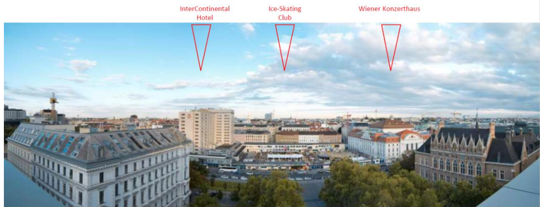
Foto 2: huidige situatie van locatie InterContinental Hotel, Ice-Skating Club en Wiener Konzerthaus.

Rendering of planned project for Ice-Skating Club site, summer view. Comparison of the originally planned project (red lines) with the project revised and rescaled in the course of a mediation procedure initiated inter alia as a result of criticisms voiced by the UNESCO World Heritage Committee